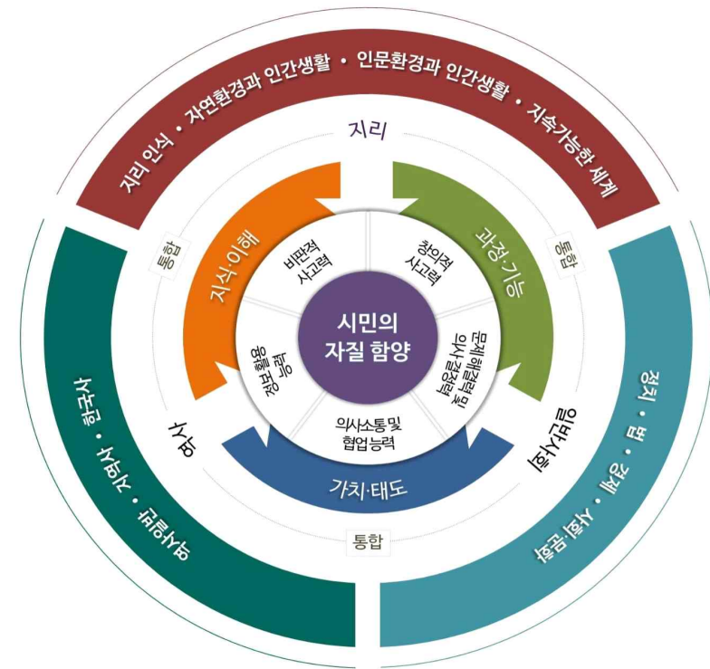
[그림] 사회과 교육과정 설계의 개요

이와 같은 사회과 교육과정 설계의 개요를 도식으로 제시하면 다음 [그림]과 같다.